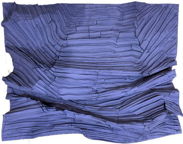
Move 2022 No.9 2022, 84 x 93 cm mixed media (clay from Ayutthaya, glue, and color powder) price 50,000 baht