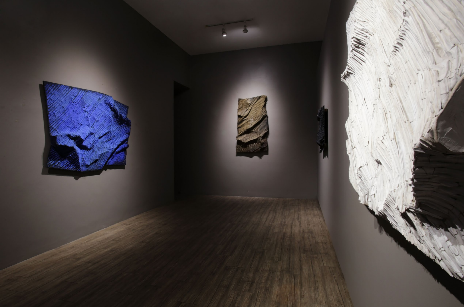
Move 2022 No.4 2022, 150 x 85 cm, mixed media (clay from Ayutthaya, glue, and color powder) price 150,000 baht