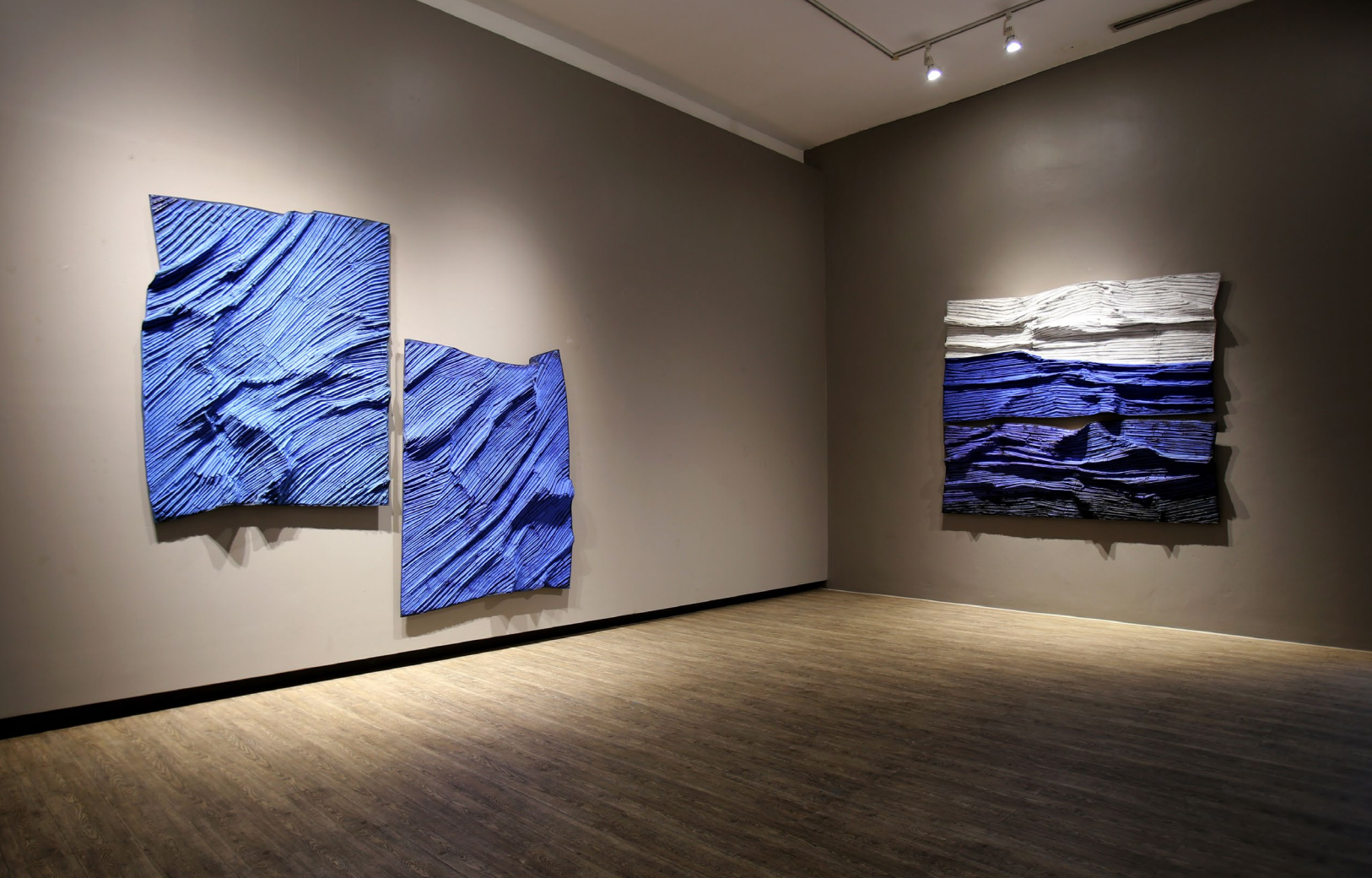
Move 2022 No.1 2021, 149 x 250 cm, mixed media (clay from Ayutthaya, glue, and color powder) price 300,000 baht