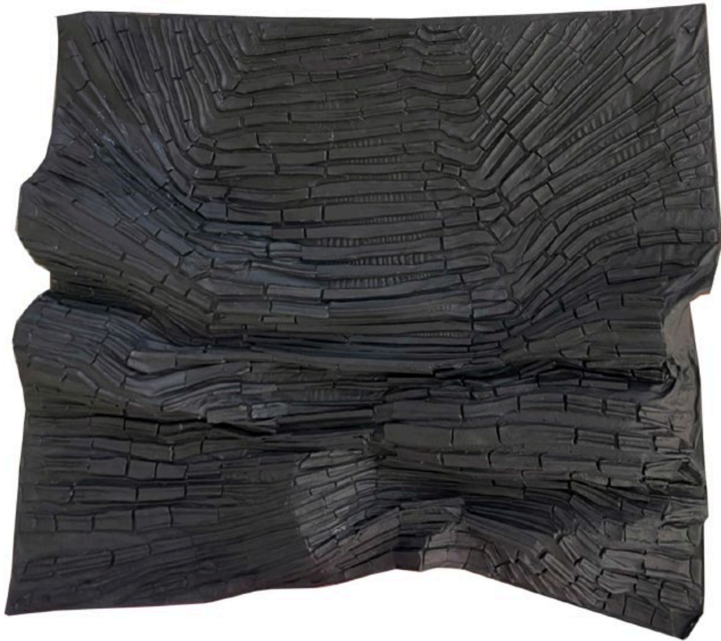
Move 2022 No.8 2022, 72 x 95 cm mixed media (clay from Ayutthaya, glue, and color powder) price 50,000 baht