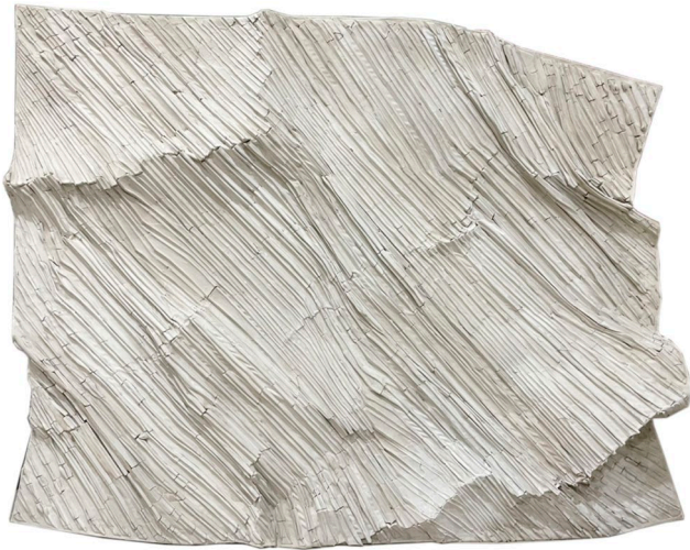
Move 2022 No.3 2022, 118 x 149 cm, mixed media (clay from Ayutthaya, glue, and color powder) price 150,000 baht