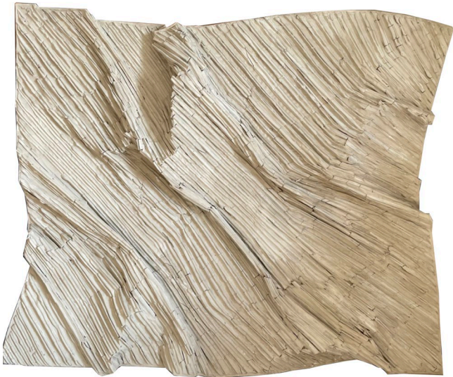
Move 2022 No.2 2022, 118 x 149 cm mixed media (clay from Ayutthaya, glue, and color powder) price 150,000 baht