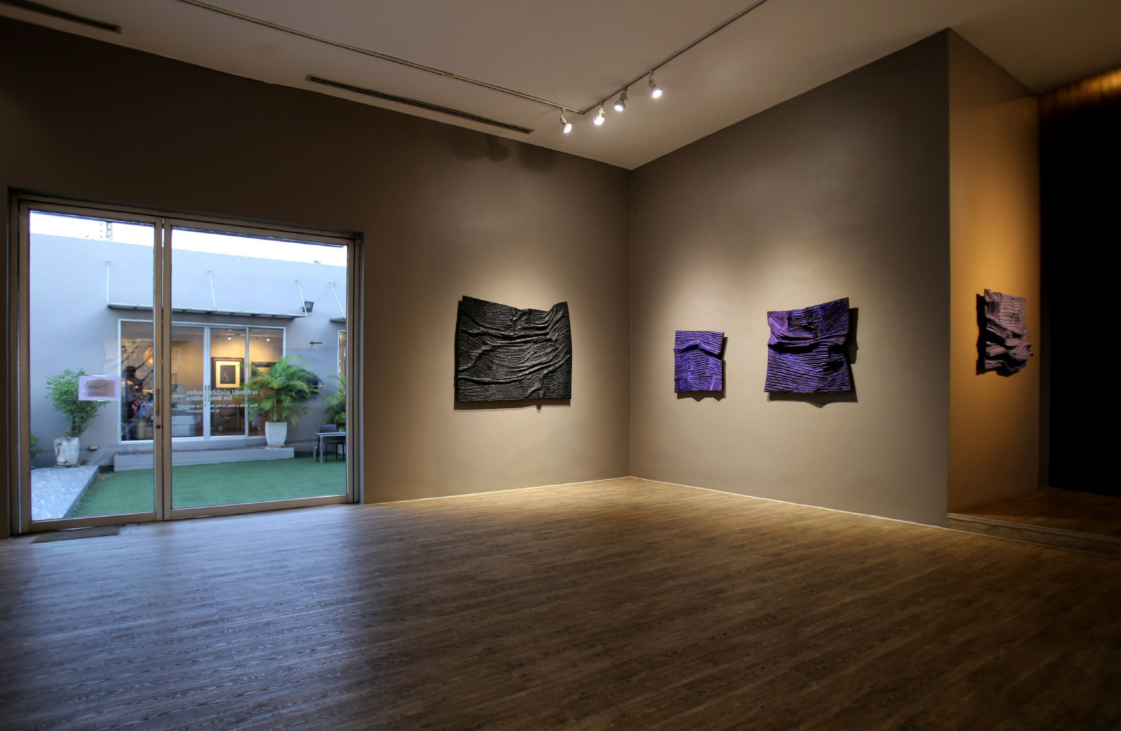
Soul of the Earth No.5 2021, 118 x 149 cm, mixed media (clay from Ayutthaya, glue, and color powder) price 150,000 baht