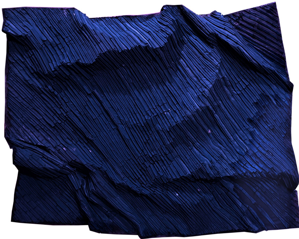
Soul of the Earth No.3 2021, 118 x 149 cm mixed media (clay from Ayutthaya, glue, and color powder) price 150,000 baht