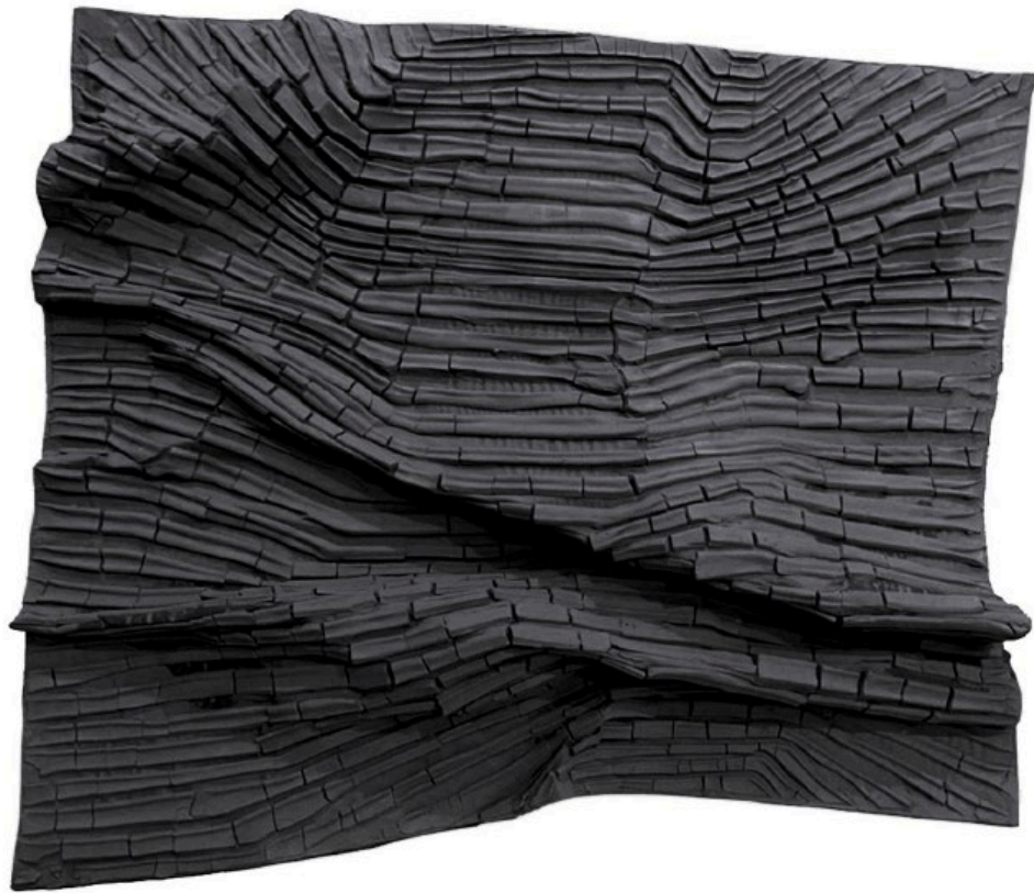
Move 2022 No.5 2022, 78 x 85 cm mixed media (clay from Ayutthaya, glue, and color powder) price 50,000 baht