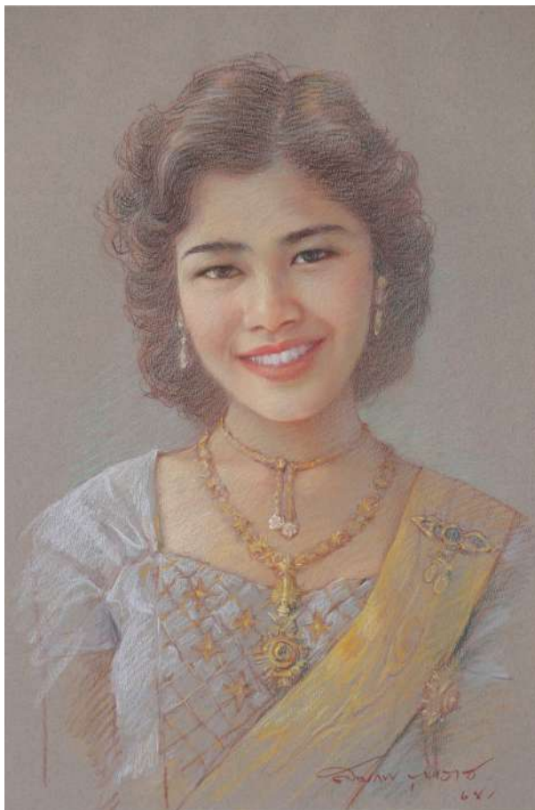
สมเด็จพระนางเจ้าสิริกิติ์ พระบรมราชินีนาถ พระบรมราชชนนีพันปีหลวง Her Majesty Queen Sirikit, the Queen Mother

2025, pastel on paper, 53 x 35 cm, 200,000 baht