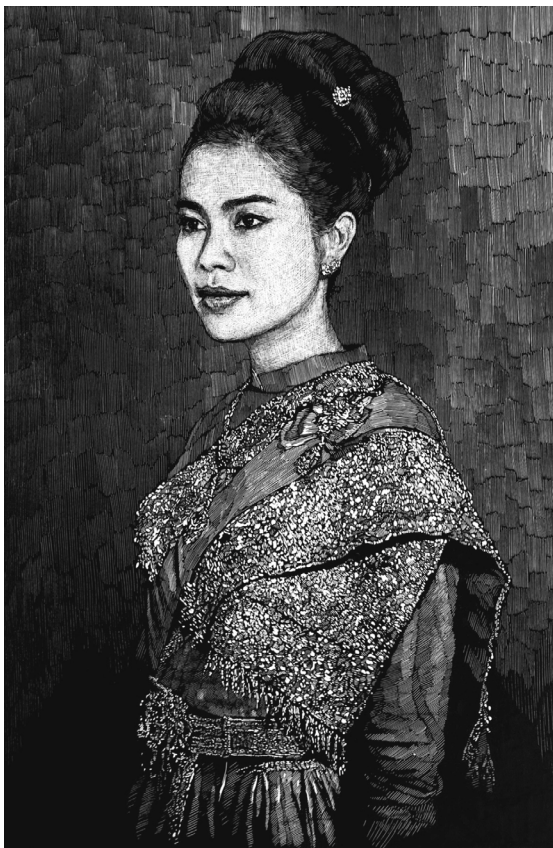
สมเด็จพระนางเจ้าสิริกิติ์ พระบรมราชินีนาถ Her Majesty Queen Sirikit

2025, woodcut, 127 x 84 cm, edition of 9, 29,000 baht