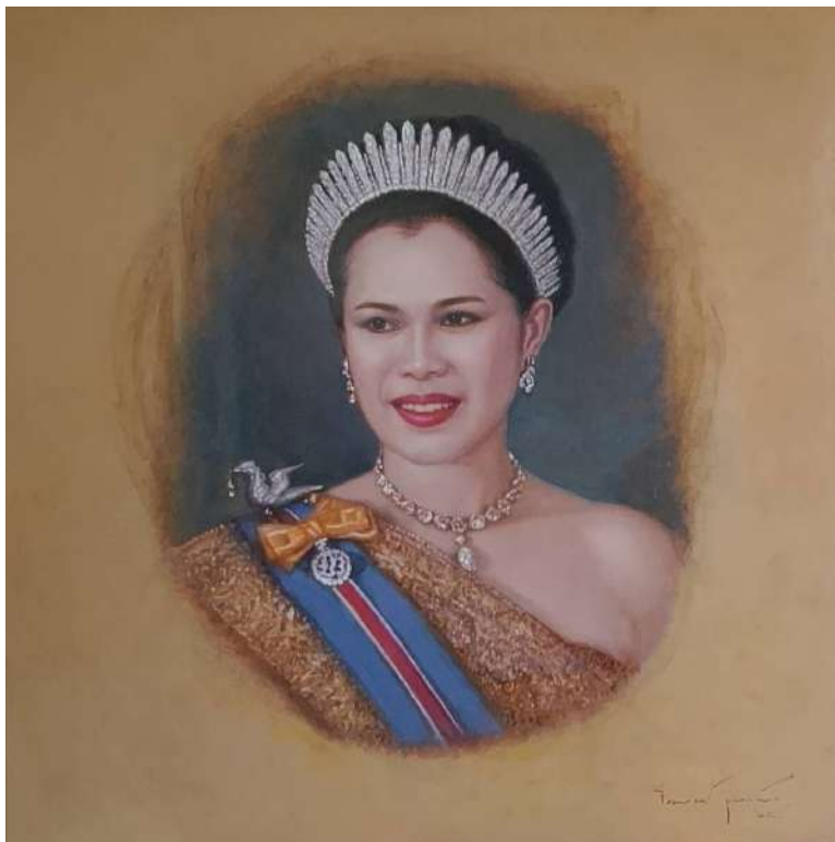
พระราชินีศรีสยาม The Queen of Thailand

2025, oil on linen canvas, 80 x 80 cm, 120,000 baht