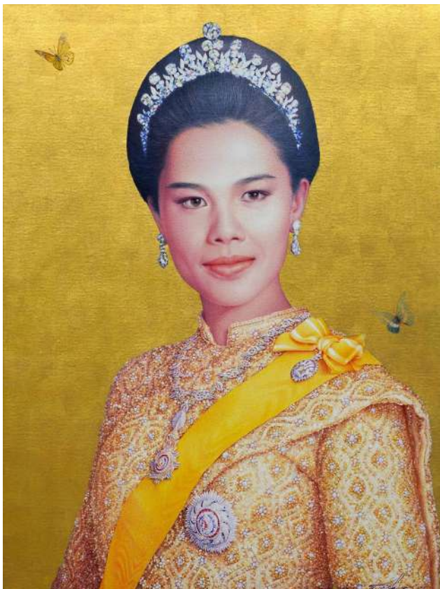
สมเด็จพระนางเจ้าสิริกิติ์ พระบรมราชินีนาถ พระบรมราชชนนีพันปีหลวง Her Majesty Queen Sirikit, the Queen Mother 2025, oil, acrylic, and gold leaf on canvas, 80 x 60 cm, 388,888 baht