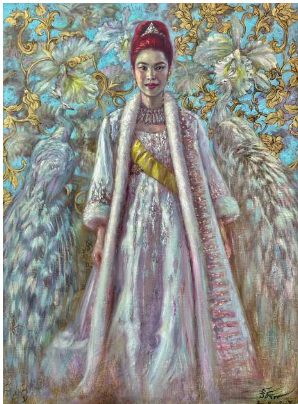
Queen Sirikit The Royal Flower of Universe