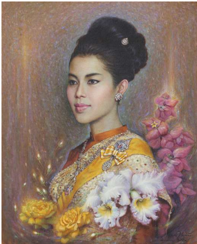
ดอกไม้แห่งสวรรค์ นามควีนสิริกิติ์ The Flower of Heaven, Queen Sirikit