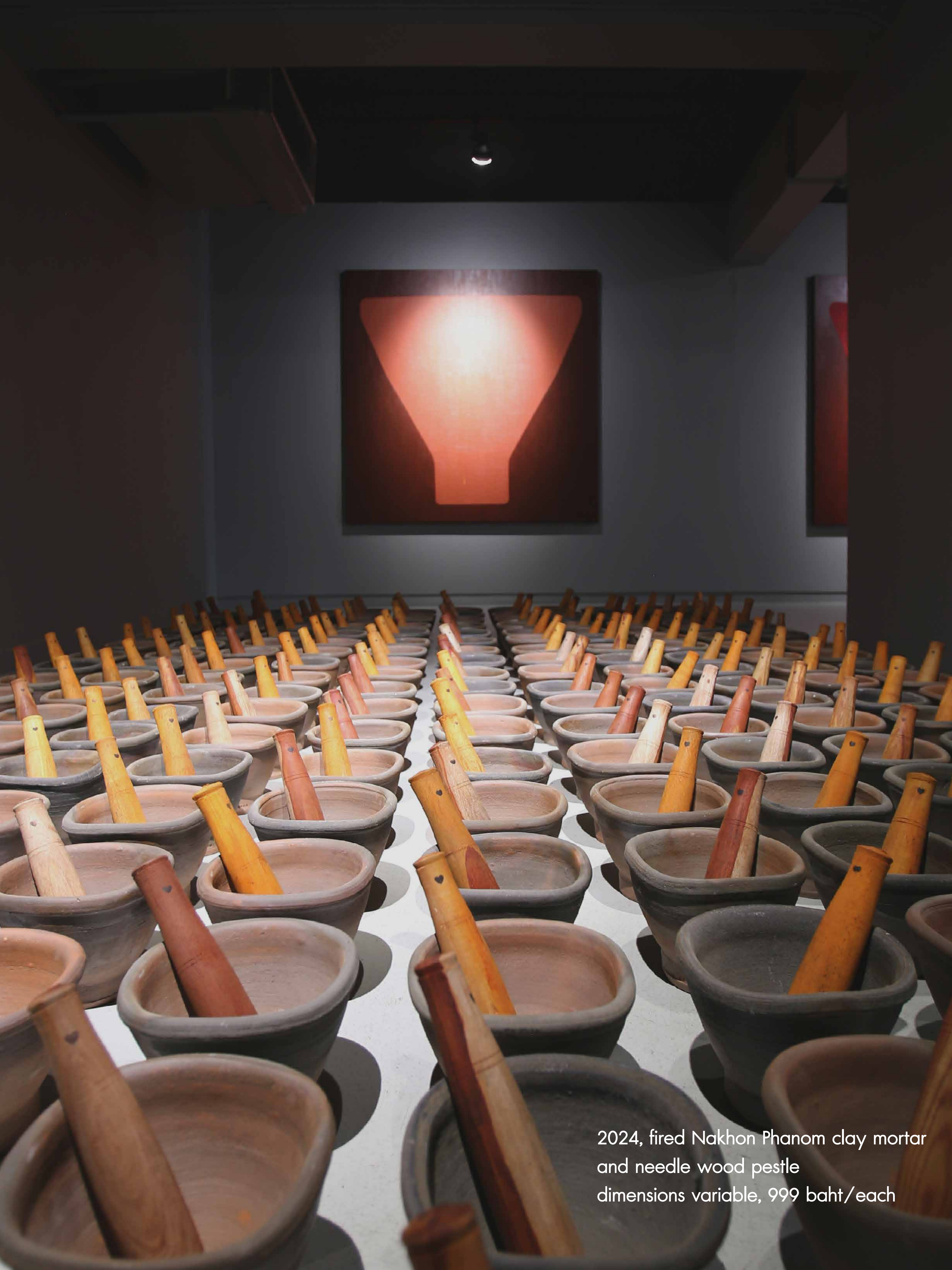
2024, fired Nakhon Phanom clay mortar and needle wood pestle dimensions variable, 999 baht/each