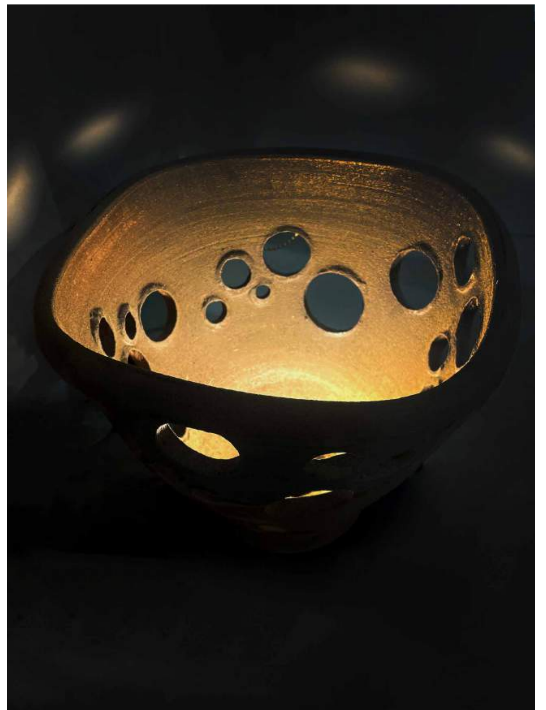
2024, fired Nakhon Phanom clay mortar and light bulb 35 x 35 x 35 cm/each 23,000 baht/each