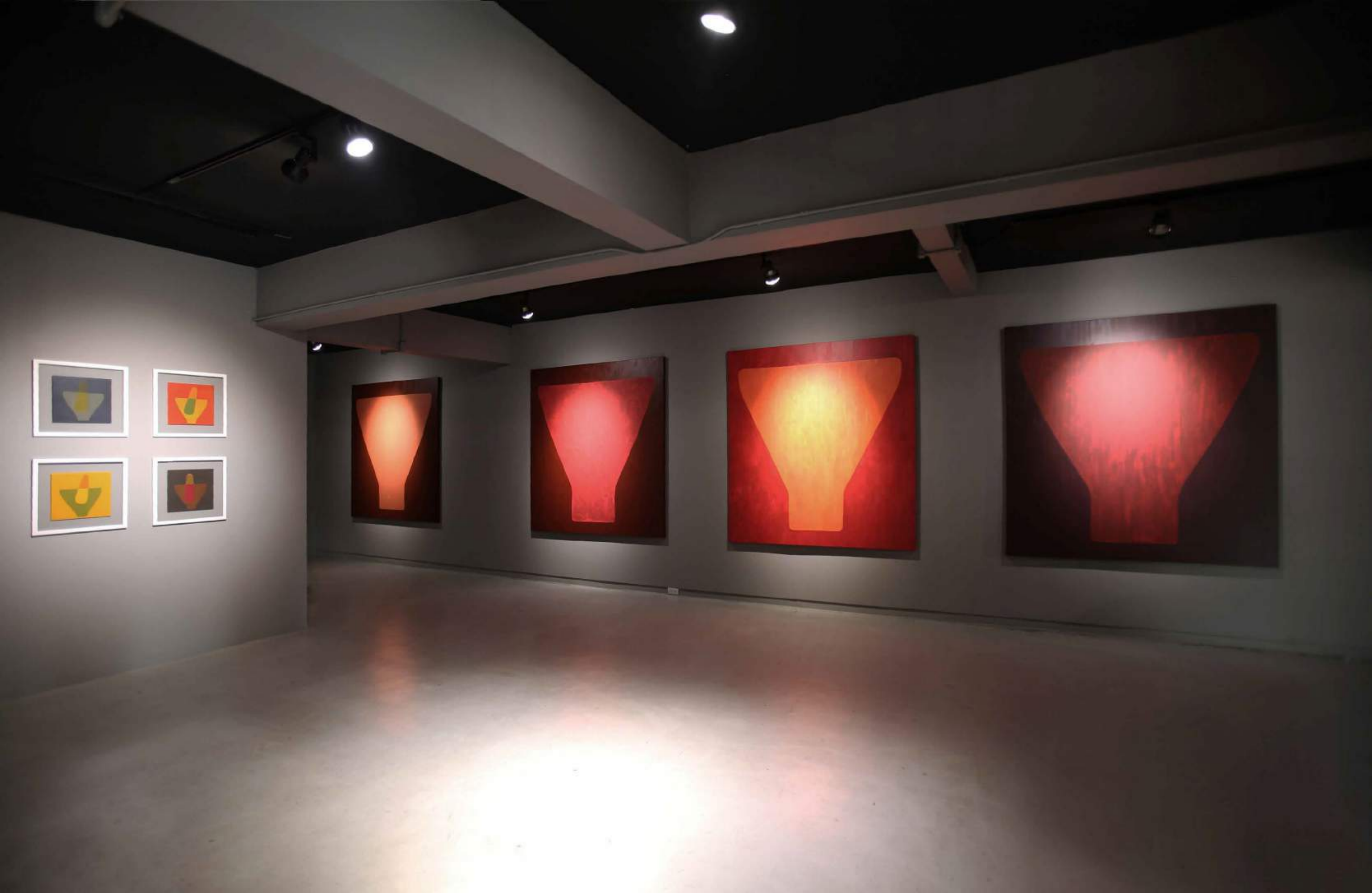
2023, acrylic on canvas 185 x 173 cm/each 120,000 baht/each